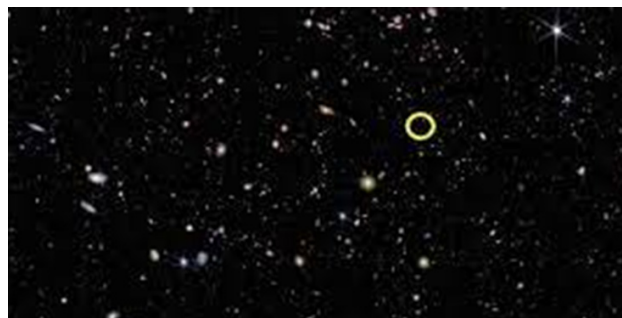
Imagen tomada por el telescopio James Webb. En el pequeño círculo, la galaxia JADES-GS-z13-0, originada “solo” 330 millones de años después del Big Bang, por lo que es una de las primeras del universo.